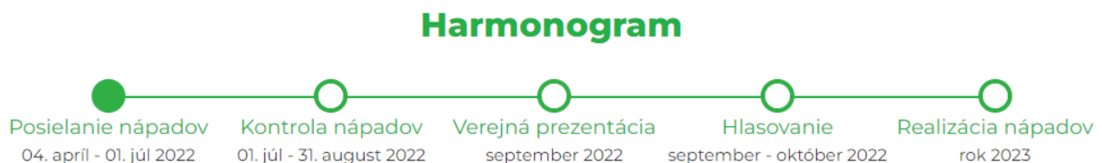
Schéma 1: Harmonogram siedmeho ročníka participatívneho rozpočtu 2022/2023

Harmonogram siedmeho ročníka participatívneho rozpočtu 2022/2023 je znázornený v schéme 1. Obsahuje presné termíny pre jednotlivé fázy participatívneho rozpočtu, konkrétne ide o posielanie nápadov, kontrolu nápadov, verejnú prezentáciu, hlasovanie a realizáciu nápadov.