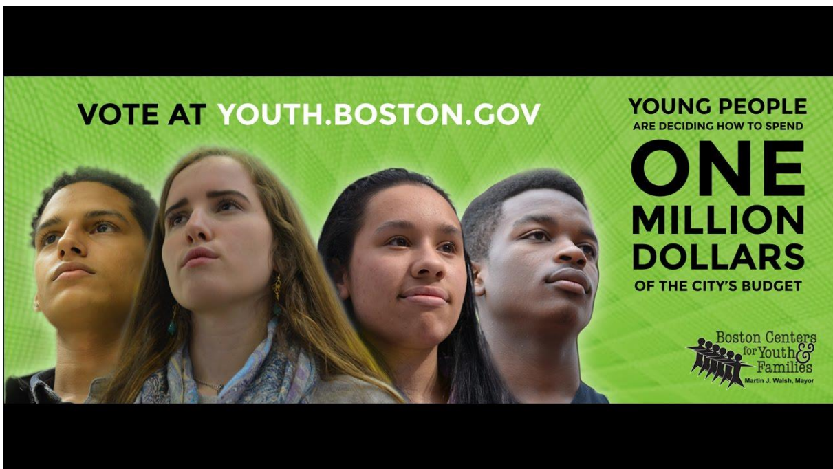
Obrázok 6: Príklad propagácie hlasovania v rámci participatívneho rozpočtu v meste Boston