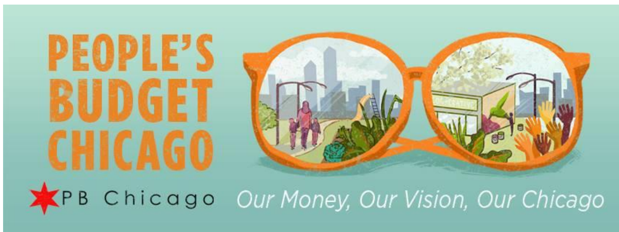
Obrázok 4: Príklad propagácie participatívneho rozpočtu v meste Chicago

Podobný model je uplatňovaný aj v iných amerických mestách, napríklad v Chicagu so slovami „Rozpočet Chicaga pre ľudí: Naše peniaze, naša vízia, naše Chicago“ (obrázok 4), či Bostone, v ktorom sa ho ujali mladí ľudia so slovami „Mládež na čele zmeny: Participatívny rozpočet Boston“ (obrázok 5 a 6), alebo v kalifornskom meste Vallejo, kde na aktivizáciu občanov využívali letáky so sloganom „Ako by ste minuli tri milióny dolárov na zlepšenie života vo Vallejo?“. Podobne, mesto Ann Arbor v americkom Michigane, využíva na aktivizáciu slogan „Tvoje doláre, tvoje nápady, tvoje mesto“.