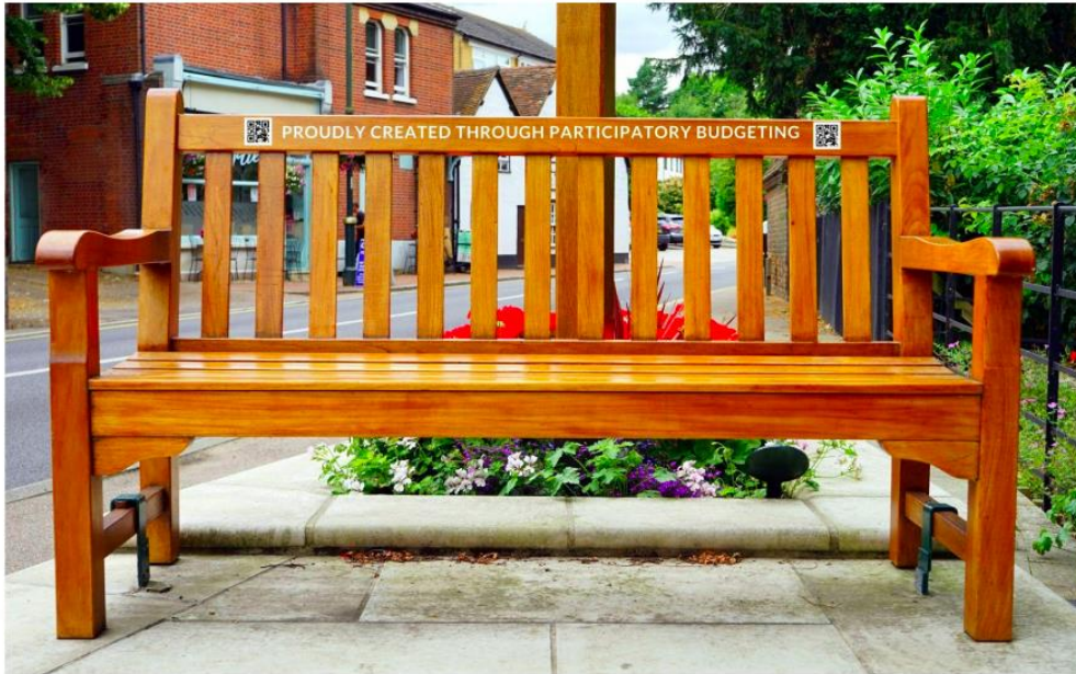
Obrázok 3: Zvýšenie povedomia o realizovaných projektoch